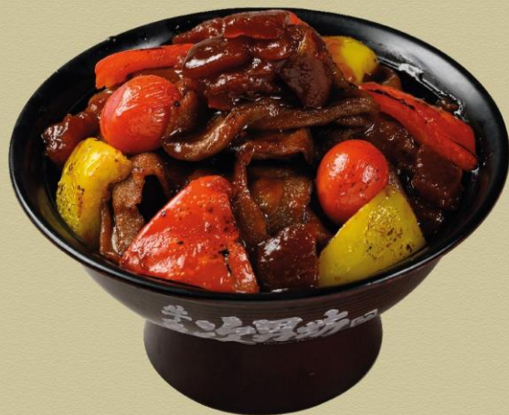
焼きベジ牛肉とチェリートマト丼