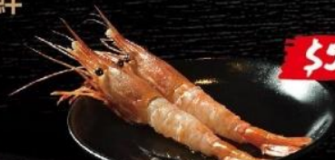
カナダ産牡丹エビ Canadian Botan Shrimp Sashimi 加拿大牡丹蝦刺身