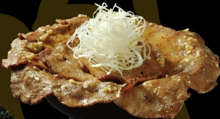
塩麴焼き牛タン丼定食 GRILLED BEEF TONGUE RICE BOWL SET 焼鹽麴牛舌丼定食