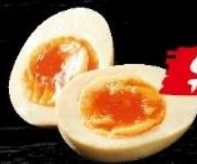
半熟味付け卵 Japanese Marinated Soft Boiled Egg 溏心蛋