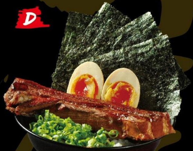
贅沢豚バラ丼定食 PREMIUM PORK BELLY RICE BOWL SET 王様! 豚肉丼定食