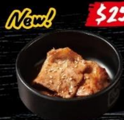
スペイン産豚肉 Spanish Pork Loin 西班牙豚梅肉