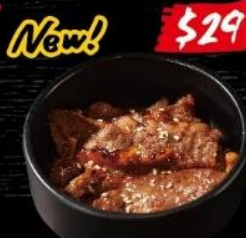
米国産カタバラ U.S. Grass-fed Beef Brisket 美國草飼牛腹腩