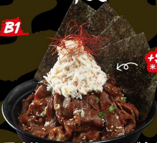
次男坊丼とカニ肉のサラダ定食 GYU-KAKU JINAN-BOU SIGNATURE RICE BOWL WI CRABMEAT SALAD SET 牛角次男坊丼配蟹肉沙律定食