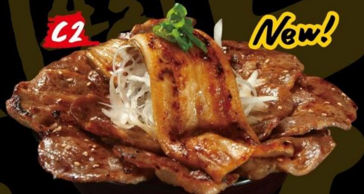
豚肉丼とアサゴ定食 GRILLED PORK RICE BOWL WI CONGER EEL SET 豚丼配穴子定食