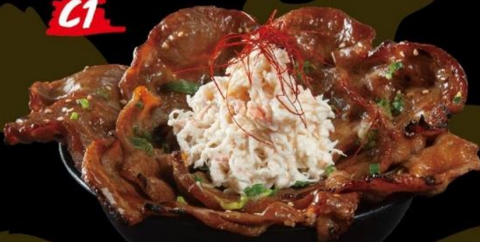
豚肉丼とカニ肉のサラダ定食 GRILLED PORK RICE BOWL WI CRABMEAT SALAD SET 豚丼配蟹肉沙律定食