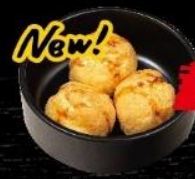
黒糖 バニラシューアイス Vanilla Ice-cream Puff w/ Brown Sugar Sauce 黑糖雲呢拿雪糕泡芙