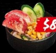
サラダ Salad 沙律