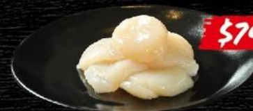
日本産生ホタテ Japanese Scallop Sashimi 日本帶子刺身