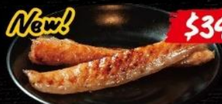
焼きとろサーモン Grilled Salmon Belly 醬燒鮭魚腩條