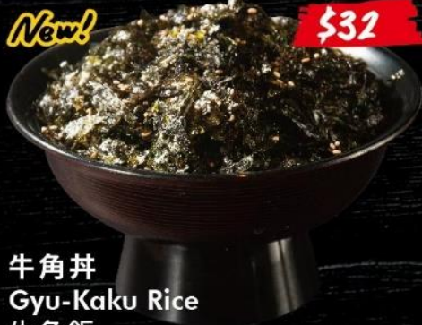
牛角丼 Gyu-Kaku Rice 牛角飯