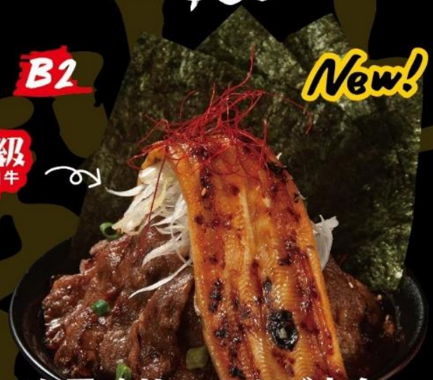
次男坊丼とアサゴ定食 GYU-KAKU JINAN-BOU SIGNATURE RICE BOWL WI CONGER EEL SET 牛角次男坊丼配穴子定食