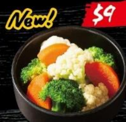
野菜 Assorted Vegetables 溫野菜